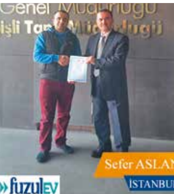
Sefer ASLAN İSTANBUL